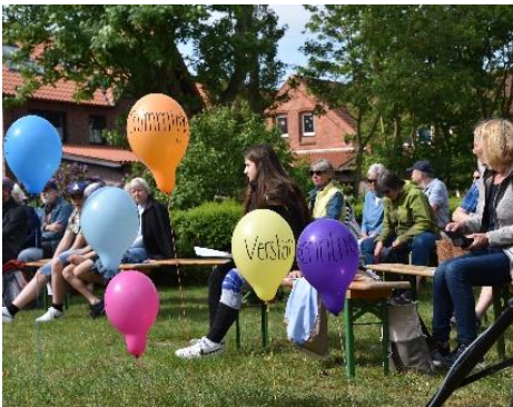
Der Pfingstgottesdienst 2024

Am Pfingstmontag, dem 20. Mai 2024 haben wir hier auf Juist bei sonnigem, aber windigem Wetter auf dem Janusplatz einen ökumenischen Pfingstgottesdienst gefeiert. Zahlreiche Gottesdienstbesucher haben sich dazu eingefunden. Das Motto dieses Gottesdienstes war „Geistesgegenwärtig bleiben – Die Geistesgaben als Ermutigung zum Christsein“. Passend zum Thema wurden während des Gottesdienstes bunte Luftballons mit verschiedenen Wörtern wie „Frömmigkeit“, „Verständnis“ oder „Erkenntnis“ in den Himmel zu Gott geschickt.