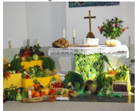
Das Erntedankfest 2023

Jetzt nähern wir uns mit großen Schritten dem Erntedankfest, das wir hier auf Juist traditionell bereits im September feiern. In diesem Jahr findet es am 21./22. September statt, beginnend mit dem beliebten „Juist klingt“ am Samstagabend. Wie im vergangenen Jahr wird es auch dieses Jahr wieder – im Anschluss an den Gottesdienst am Sonntag um 10.30 Uhr in der ev. Inselkirche – Speis und Trank, Musik, sowie zahlreiche Aktionen und Präsentationen für Groß und Klein entlang der Wilhelmstraße geben. Der Erlös kommt wie immer guten Zwecken innerhalb und außerhalb der Insel zugute.