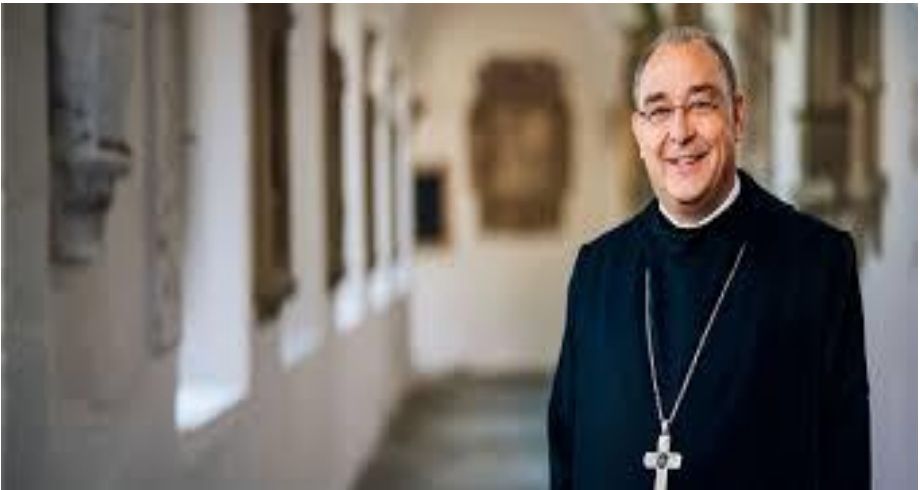
Der neue Bischof Dr. Dominicus Meier

Der neue Bischof Dominicus gehört der Benediktiner-Abtei Königsmünster in Meschede an, deren Abtei er zwölf Jahre als Abt vorstand, bevor er im September 2015 als Weihbischof nach Paderborn gegangen ist. In einem ersten Brief schreibt er: „Ich spüre ein großes Interesse in mir, die reiche Vielfalt des Bistums Osnabrück kennenzulernen, vor allem die Menschen.“ Und es gibt bereits erste Planungen, dass der neue Bischof sehr bald Ostfriesland und die Inseln besuchen wird. Da sagen wir gerne: Moin und herzlich willkommen!