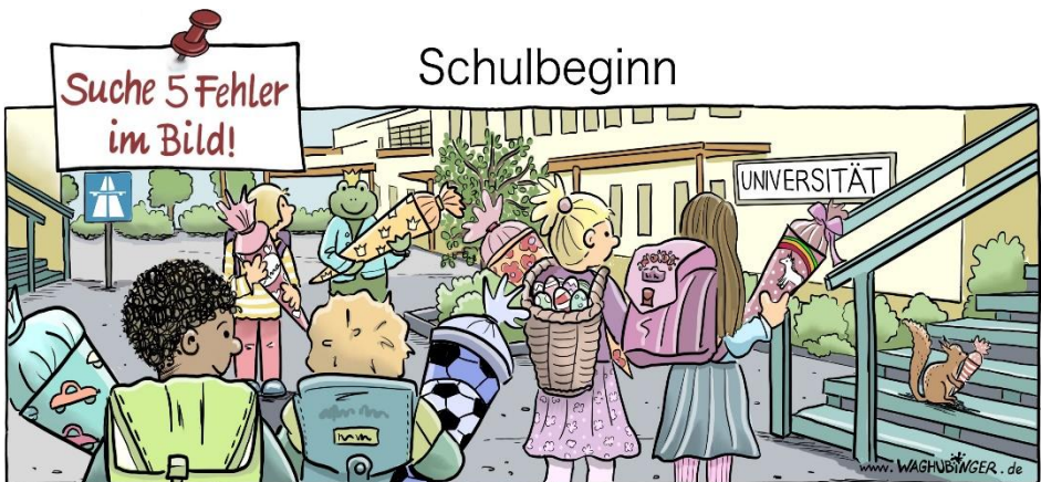
Autobahnschild: Frosch, Korb mit Ostereiern, „Universitäts“, Eichhörnchen

Mit dabei war auch Fiete, das Maskottchen des Blockflöten-Orchesters.